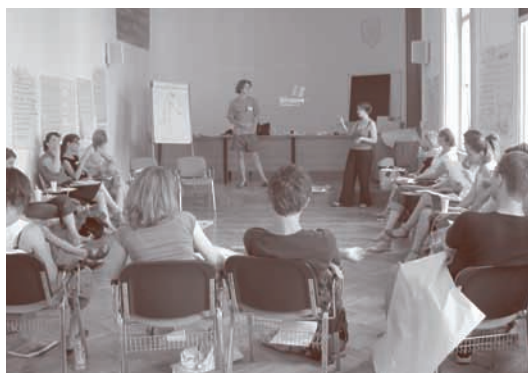
Letná škola manažmentu kultúry Viedeň – Bratislava

Na projekte sa zúčastnilo 20 študentov bratislavských a viedenských univerzít rôzneho zamerania. V rámci letnej školy si mohli účastníci odskúšať skupinovú prácu na prípadových štúdiách, mohli si otestovať jednotlivé kroky projektového manažmentu, ako aj oboznámiť sa s fungovaním konkrétnych kultúrnych organizácií.