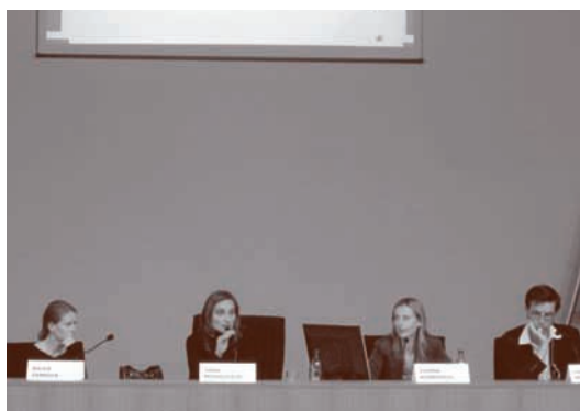
Prezentujúci na seminári Finančné zdroje pre kultúru v Žiline