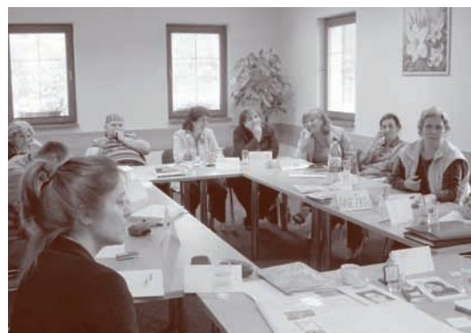
Vzdelávací tréning v Liptovskom Jáne

Témy: Vedenie organizácie & Komunikácia; Strategické myslenie; Finančné stratégie; Kultúrna politika; Lobing; Advokácia; Medzinárodná spolupráca