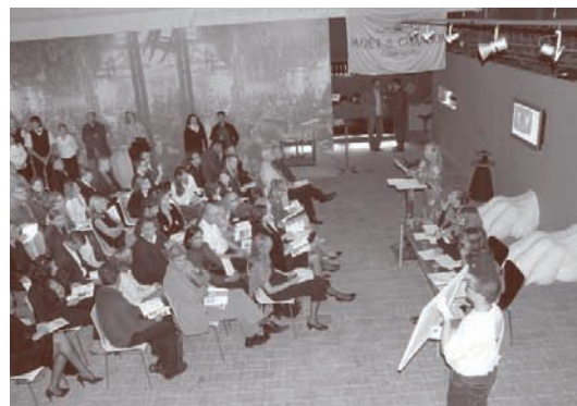
Aukcia súčasného slovenského výtvarného umenia

V tomto roku bola prezentovaná reprezentatívna kolekcia 87 diel 64 renomovaných slovenských umelcov a umelkyní takmer všetkých vekových kategórií vrátane najmladšej a nastupujúcej generácie. Predstavila aktuálne prúdy a témy v čo najširšom mediálnom zastúpení; t. j. od klasických disciplín ako sú maľba, socha, grafika, až po objekt, inštaláciu, video, nevynímajúc fotografiu a printové médiá. Opätovne sa táto aukcia vyznačovala svojim podporným filantropickým rozmerom, keďže 60 % z predaného diela išlo samotnému autorovi a 40 % autor venoval v prospech grantového kola výtvarného umenia, v ktorom sa môžu uchádzať o granty profesionálni výtvarníci so svojimi projektmi. Aukcia bola opätovne sprevádzaná aj sedemdňovou výstavou, ktorú navštívilo približne 180 návštevníkov. Samotná dražba sa uskutočnila 11. októbra 2006 kde bolo z 87 diel predaných 38 diel v hodnote 1 004 000,-Sk.