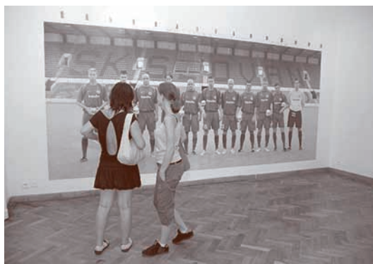
Záber z výstavy Ceny Oskára Čepana 2006